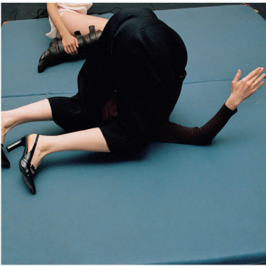
Splendid (Performance)