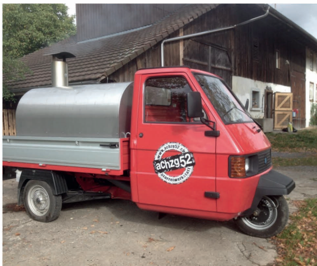
Pizzamobil der Kirche Maria Lourdes